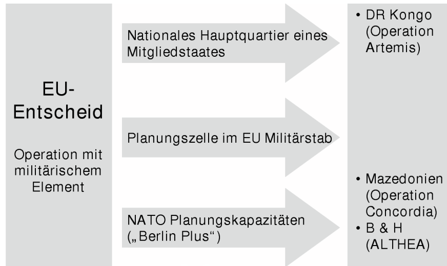
Abbildung 3: EU Operationen